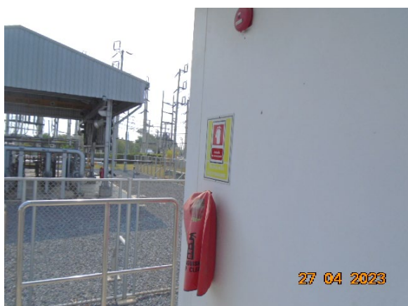
ภาพที่ 2-4 เครื่องดับเพลิงแบบเคมีผง