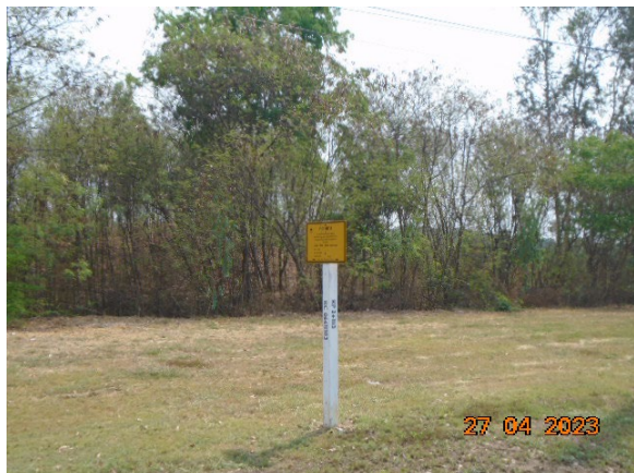
ภาพที่ 2-1 ป้ายแสดงตำแหน่งแนวท่อส่งก๊าซธรรมชาติ