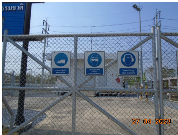
ภาพที่ 2-7 ป้ายเตือนให้สวมใส่อุปกรณ์คุ้มครองความปลอดภัยส่วนบุคคล