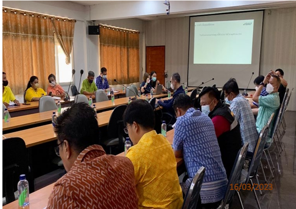
วันที่ 16 มีนาคม พ.ศ. 2566