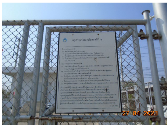
ภาพที่ 2-2 ป้ายแสดงกฎความปลอดภัยสถานีก๊าซ