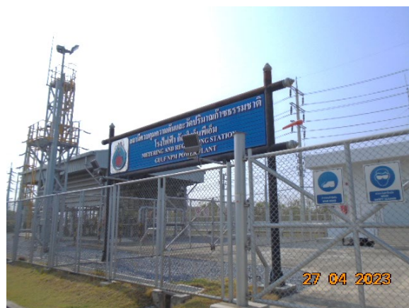
ภาพที่ 2-3 สถานีวัดและควบคุมแรงดันก๊าซ (MRS)