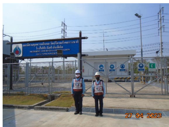
ภาพที่ 2-5 เจ้าหน้าที่รักษาความปลอดภัย บริเวณสถานี วัดและควบคุมแรงดันก๊าซ (MRS)