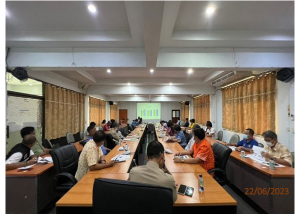
วันที่ 22 มิถุนายน พ.ศ. 2566